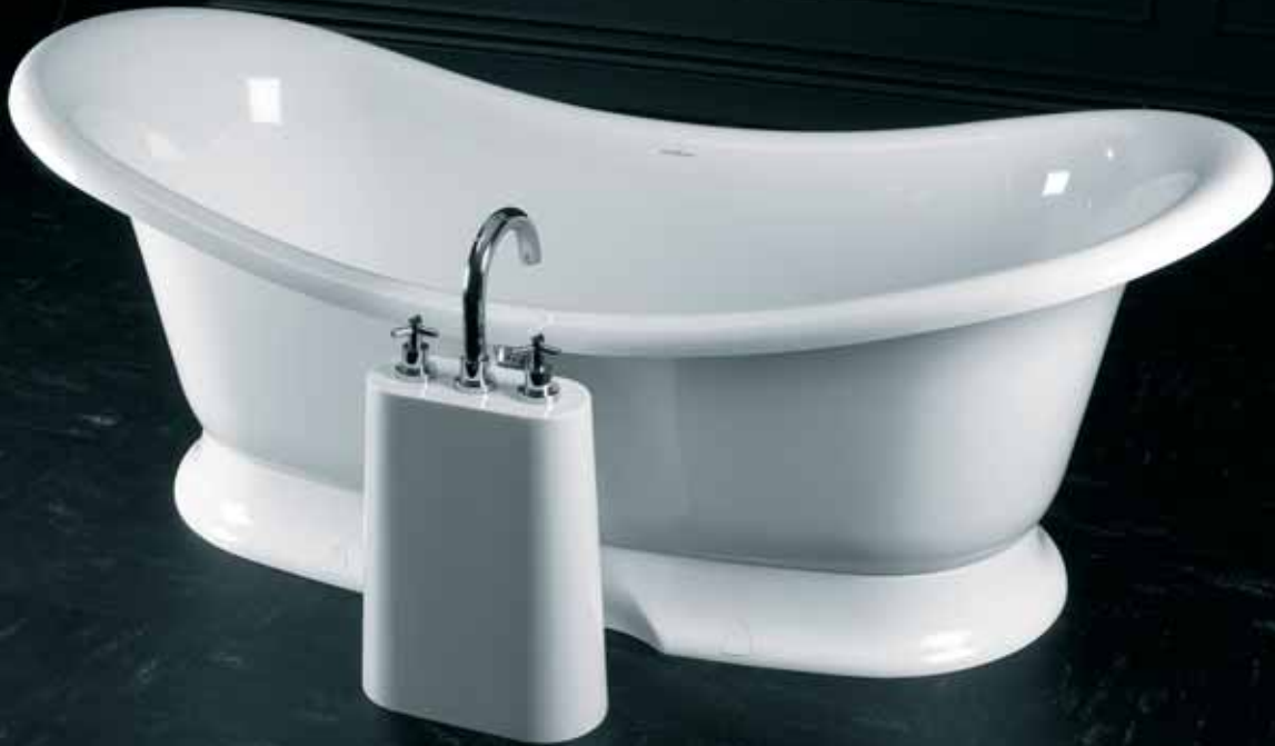
Lido (LID-N-SM) + Marlborough (MAR-B-SW)