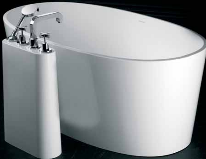
Lido Grande (LID-N-LG) + ios (IOS-N-SW)